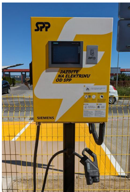
DC 30 kW nabíjacia stanica